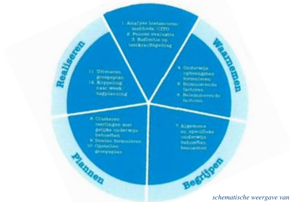
schematische weergave van de HGW cyclus

De hierboven omschreven cyclus wordt tweemaal per jaar doorlopen. De eerste periode loopt tot aan de kerstvakantie en de tweede periode loopt tot aan de zomervakantie.